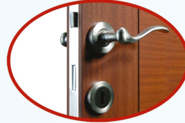
Kilit, kol ve anahtar yerini hızlı ve hassas bir şekilde açar. / Machine can open lock, handle and key position fast and precise