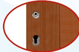
Barel kilit açabilir. The outer door can open the barrel lock.