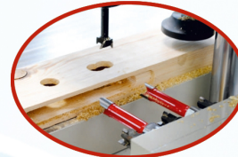
Farklı çaplarda tarama, osilasyon ve kol yeri bıçakları takılabilir. Different diameters of milling, oscillating and arm drilling cutters can be installed.