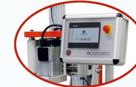
Kilit derinlik ölçüsünü, kol ve anahtar delik merkezi ayarlarını dokunmatik kontrol panelinden ölçü yazarak değiştirilebilir. Lock depth gauge, arm and key hole center setting can be changed by typing the measure from the touch control panel.